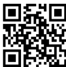
Mapa do Percurso

Percurso: Rota «Da Foz ao Boco» Distância: 11,5 Km Duração: 3 horas Dificuldade: Moderado Piso: Arenoso e Alcatroado Ponto de Partida / Chegada: Foz do Rio Lis / Boco