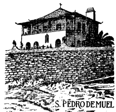
onde a terra se acaba e o mar começa