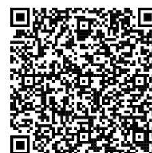
Track do percurso