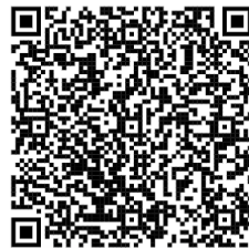
Mapa do percurso