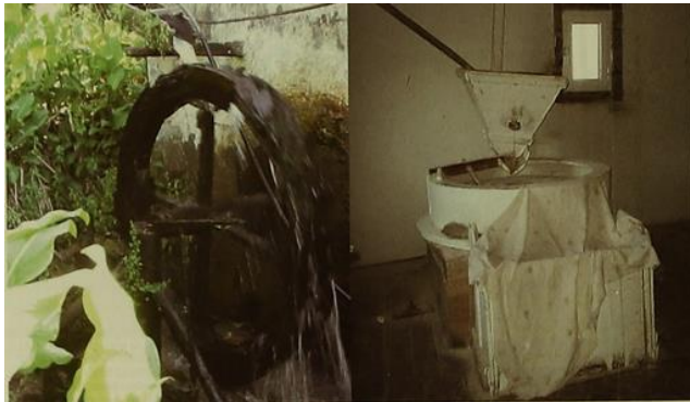
Moinho de água

É uma das estruturas mais primitivas, que tem como função aproveitar a energia cinética da movimentação das águas de rios e ribeiros. Este aproveitamento vai fazer movimentar os rodízios de madeira que estão ligados a uma mó, permitindo ter vários modos de utilização essenciais para o nosso quotidiano. Neste caso, o moinho mói qualquer tipo de cereal (trigo, milho, cevada, aveia) transformando-o em farinha.